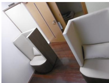
② 1人用ソファ × 2