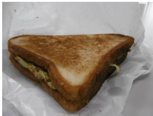
韓国トースト (OPEN 価格 250円!)