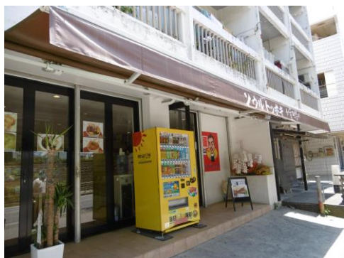
自販機ドリンクがすべて100円!