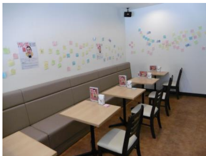
お客さんからの素敵なメッセージが 壁いっぱいになりました。