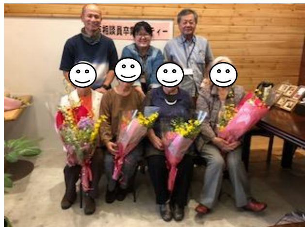
前列：家族相談員の皆さま 後列：職員