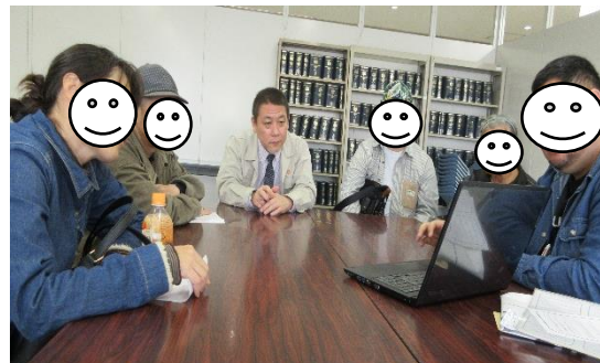
市役所の会議室にて報告

2月27日に那覇市障がい福祉課を訪問し1年の活動報告をしてきました。障害者手帳を利用した活動や、事業所見学の感想など、活動写真を見ながら報告できました。担当して下さった障がい福祉課の職員さんも、次年度の活動も楽しみにしていますとお話がありました。