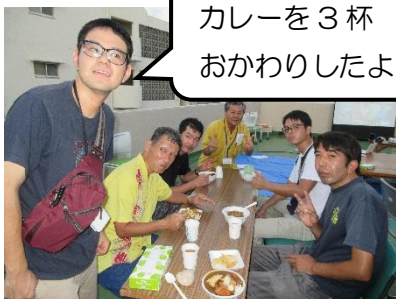
軽食はカレーやオードブル