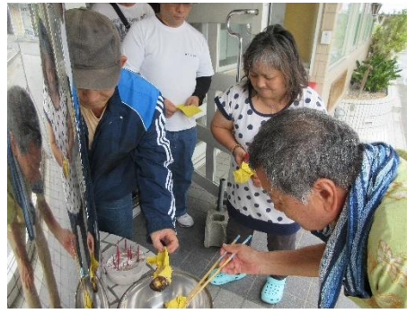
玄関先でうちかび体験