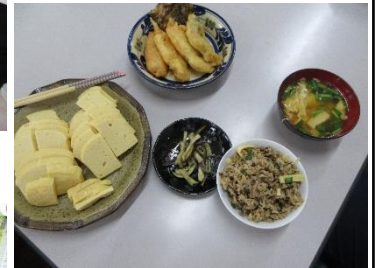
おいしいジュース