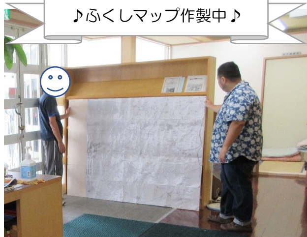
♪ふくしまップ作製中♪