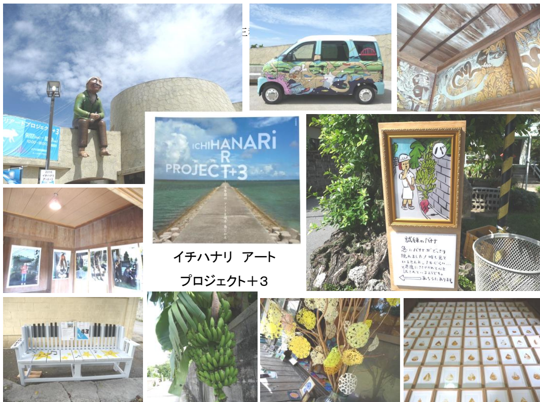
イチハナリ アート プロジェクト+3